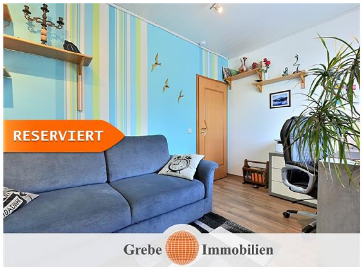
Kinderzimmer Bild 2