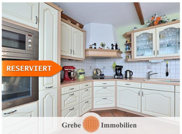
... mit Zugang ...