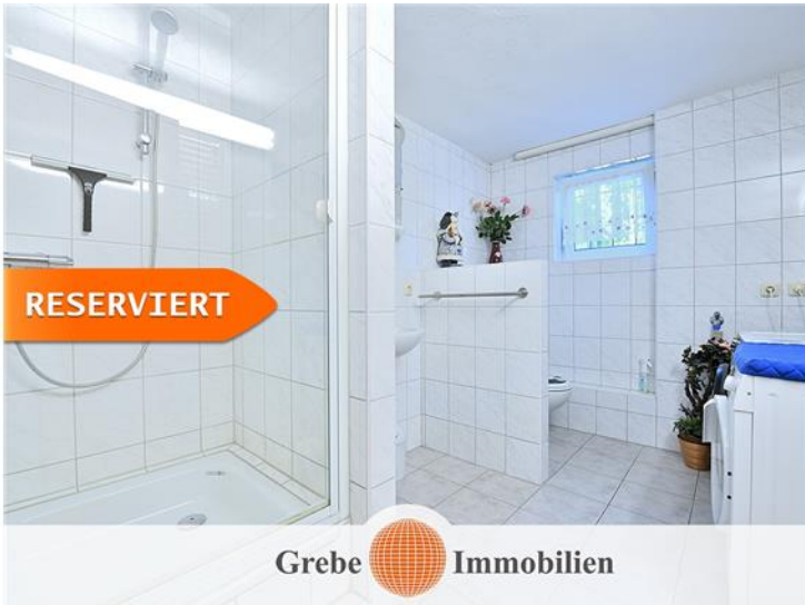
Bad mit Dusche im Keller