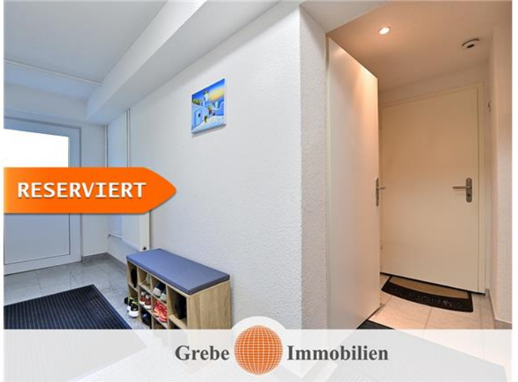
Eingangsbereich im Keller