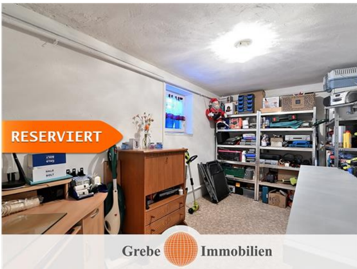
Werkstatt Bild 2