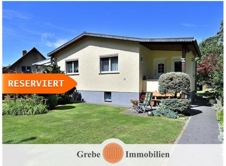
Willkommen zu Hause