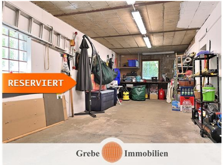
Tiefgarage Bild 2