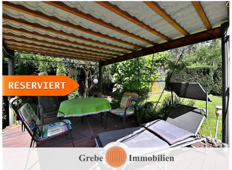
Lounge Bild 2