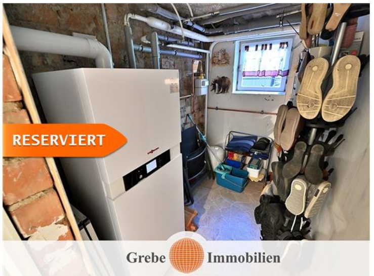
Gasheizung aus 2017