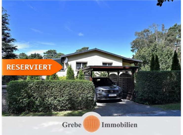
Carport für Schnellparkler