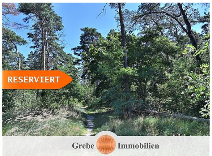
Zugang zum Wald